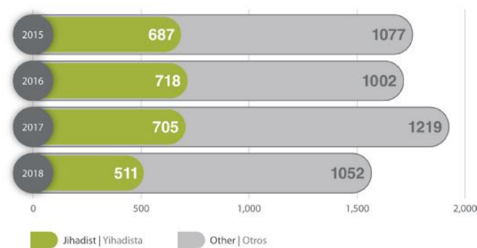
Graphic 1. Arrests in the EU for terrorism-related offences 2015-2018 Gráfico 1. Detenciones en la UE por delitos relacionados con el terrorismo 2015-2018

Source of the data: Agenfor International based on START, EUROPOL and EUROJUST. | Fuente de los datos: Agenfor International basada en START, EUROPOL y EUROJUST.