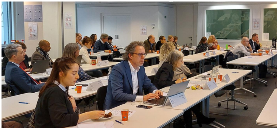
Abschließende Sitzung im Plenum.

Was schließlich die Nutzung digitaler Möglichkeiten zur Förderung des EU-Instruments betrifft, so sprachen sich die Praktiker:innen für Newsletter aus, die sich an Richter:innen, Staatsanwält:innen, Rechtsanwält:innen, Bewährungshelfer:innen und andere Expert:innen richten. Eine interessante Idee ist auch die Nutzung von KI zur Aktualisierung des Intranets von Justizbehörden, aber auch zur Schaffung einer Plattform auf der Expert:innen Fragen stellen können, Antworten erhalten und direkt mit ihren ausländischen Kolleg:innen in Kontakt treten können, um bspw. "Best Practices" auszutauschen.